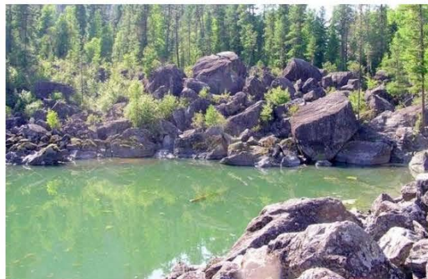
Golf de pierre