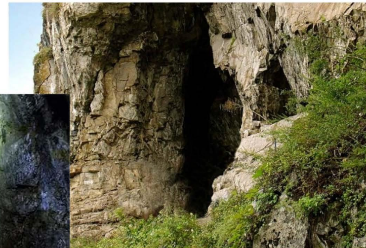
Grottes de Tavda