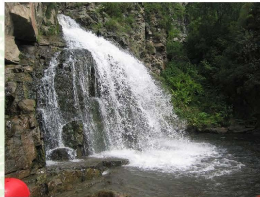
La cascade de Kamychlin