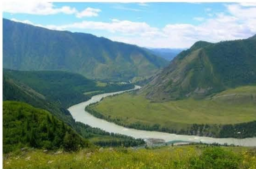
Golfe de pierre la rivière Katun