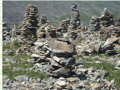
Châteaux d'esprits de montagne